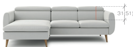
sedacia súprava OBL + 2BP 1. balík - OBL - 172x95x60 cm (0,98m 3 , 42kg) 2. balík - 2BP 160x105x60 cm (1,01m 3 , 47,5kg)